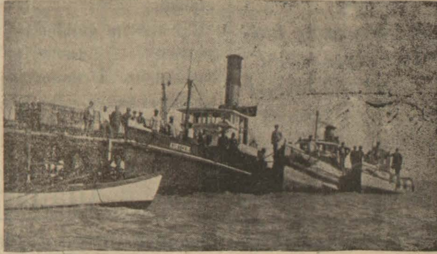
Her yıl biraz daha gelişen Mersin liman sosyetesinin yükleyip boşaltma araçlarındau Birisi

—Programı ikinci sayfada aynen yazıyoruz —