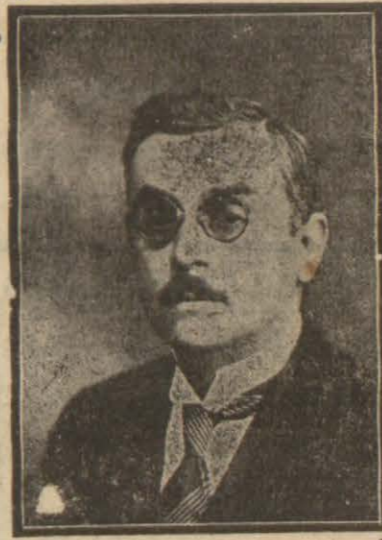
Ekonomi Bakanı Celâl Bayar

Celâl Bayar Atatürkten önemli direktif aldı